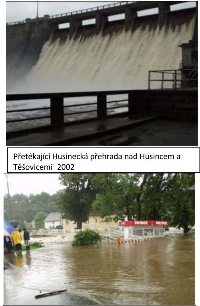
Přetékající Husinecká přehrada nad Husincem a Těšovicemi 2002