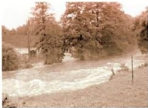
▲ Dravé proudy, které se hnaly kolem Hanušova mlýna v roce 2002.