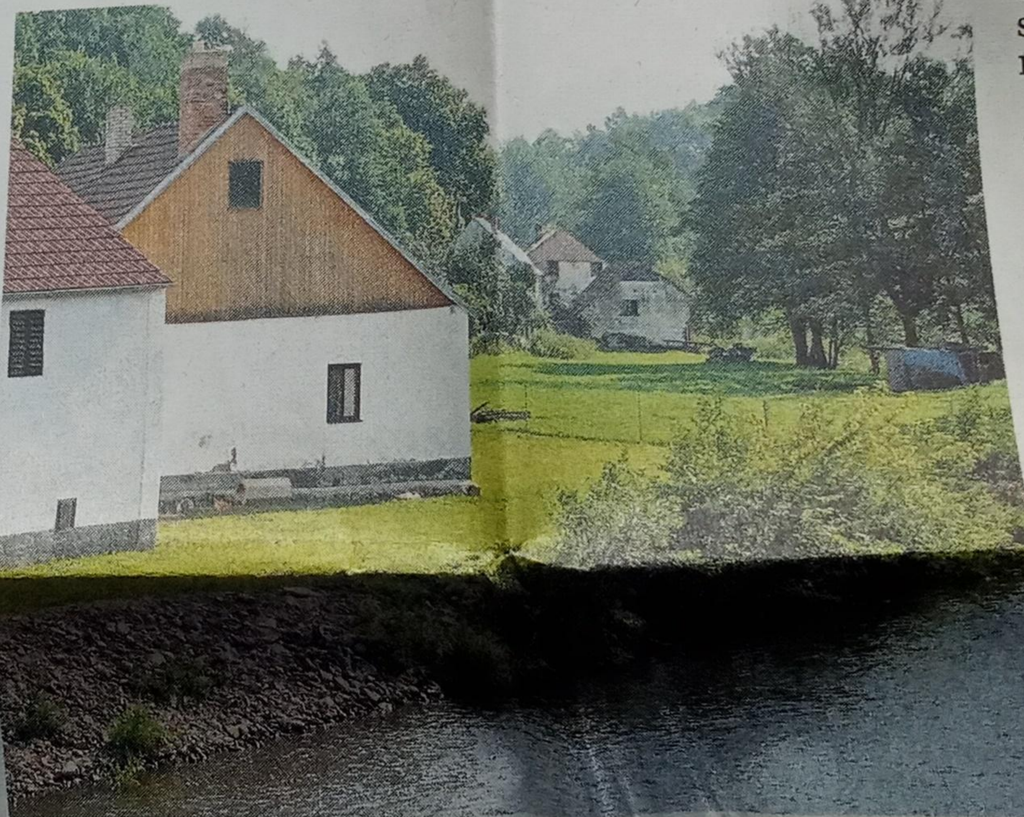
OPRAVENO. Při nízkém stavu vody a slunečném dni vypadá břeh řeky Blanice mírumilovně. Ale i tady se trhaly zdi.

„Rychle jsme nanosili pytle s pískem. To nám nakonec