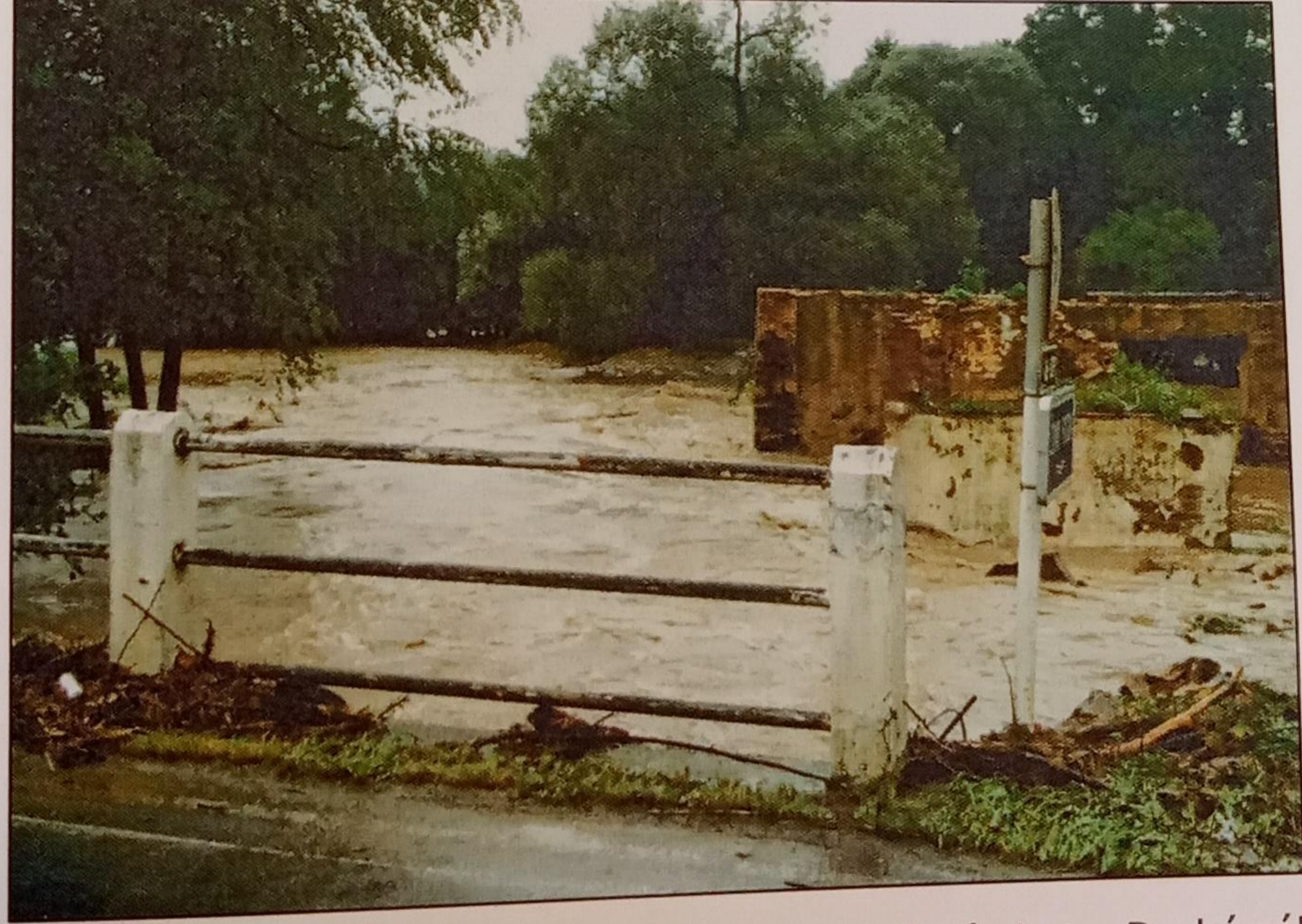
Na fotografii vlevo je valící se voda přes můstek „v Hradišku“ na silnici do Bělečské Lhoty. Druhý záběr dokumentuje rozvodněný Živný potok u Bělečského mlýna