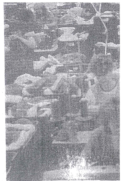
Fotografie provedla mimo fotografických služeb rámovací a písmomalířské práce. Svě služ- by rozšířilo o reportážní foto- grafii, barevné fotografie, zvět-

„Pomoc postíženým občanům byla zajištěna v celé šíři potře- by, tj. od náhradního ubytování, ošacení, stravování, oprav spo- třebičů, zabezpečení stavebního materiálu, finančních prostředků až po úklidové práce. Pomoc při záchranných pracích neodmítl žádný z podniků. Největší podíl na zvládnutí situace poskytnu- tím mechanizace mají Okresní správa silnic v Jihlavě a Třebí-