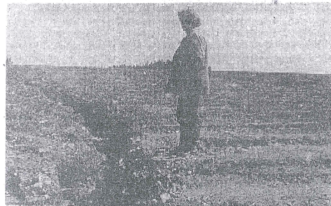
● Při noční bouři dne 21. dubna 1988 bylo nejvíce postiženo obyvatelstvo v Lukách nad Jihlavou a okolí. Na kozlovských polích si klestila voda cestu do potoka. Škody, které vznikly na zemědělské půdě se budou velice pomalu odstraňovat. Nehledě na to, že si vyžadají značné náklady a velké množství lidského úsilí a práce.

V průběhu roku 1987 vešly v platnost měrné náklady na tech- (Pokračování na str. 3)