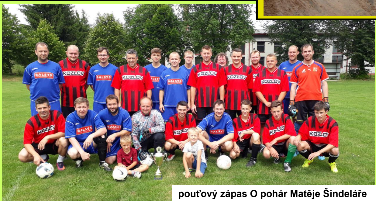
pout'ový zápas O pohár Matěje Šindeláře

Vydává Obec Kozlov, 58821 Kozlov 68, tel. 567219605, e-mail: obec@kozlov-jihlava.cz Registrační číslo: MK ČR E 20794, vychází 4 x ročně, náklad 200 kusů. Vyšlo v září 2019, uzávěrka pro příští číslo 10.12.2019 Příspěvky přijímáme na adrese: zpravodaj.kozlov@seznam.cz