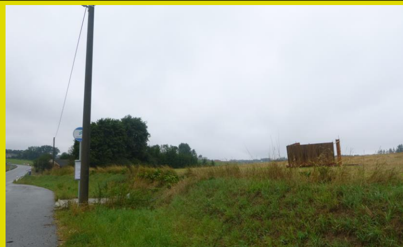
následky přívalového deště 1. září: Loudilka, Kozloveček