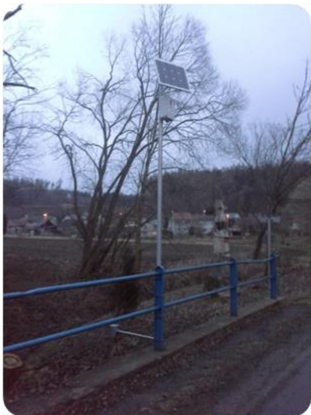
AMM - Hladinoměř